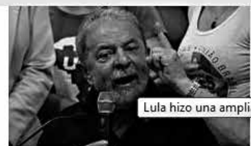
Lula hizo una amplia declaración, acusando

"Esta mañana me sentí un prisionero", dijo Lula da Silva tras su interrogatorio en una comisaría