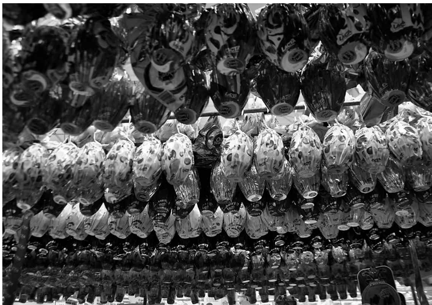
Ovos de chocolate que oferecem brinquedos têm que exibir o selo de identificação de conformidade, esclarece o Imeq