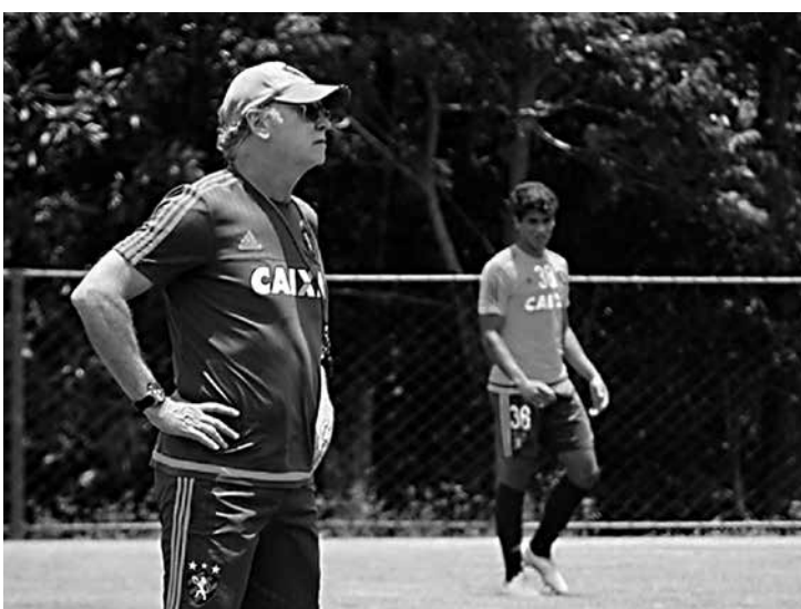
Técnico do Sport não vai poupar jogadores contra o Fortaleza

Como se não bastasse isso, Falcão ainda terá que