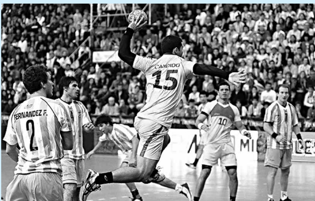
A inclusão do cartão azul nas partidas de handebol será uma das novidades nas Olimpíadas

O cartão azul é um tipo de expulsão da partida que possibilita a suspensão do atleta por outros jogos. Outra regra alterada é em relação ao goleiro-linha. A partir das mudanças, não será mais necessário que um atleta tenha o uniforme de goleiro em quadra. Assim, o time pode atuar com sete jogadores de linha