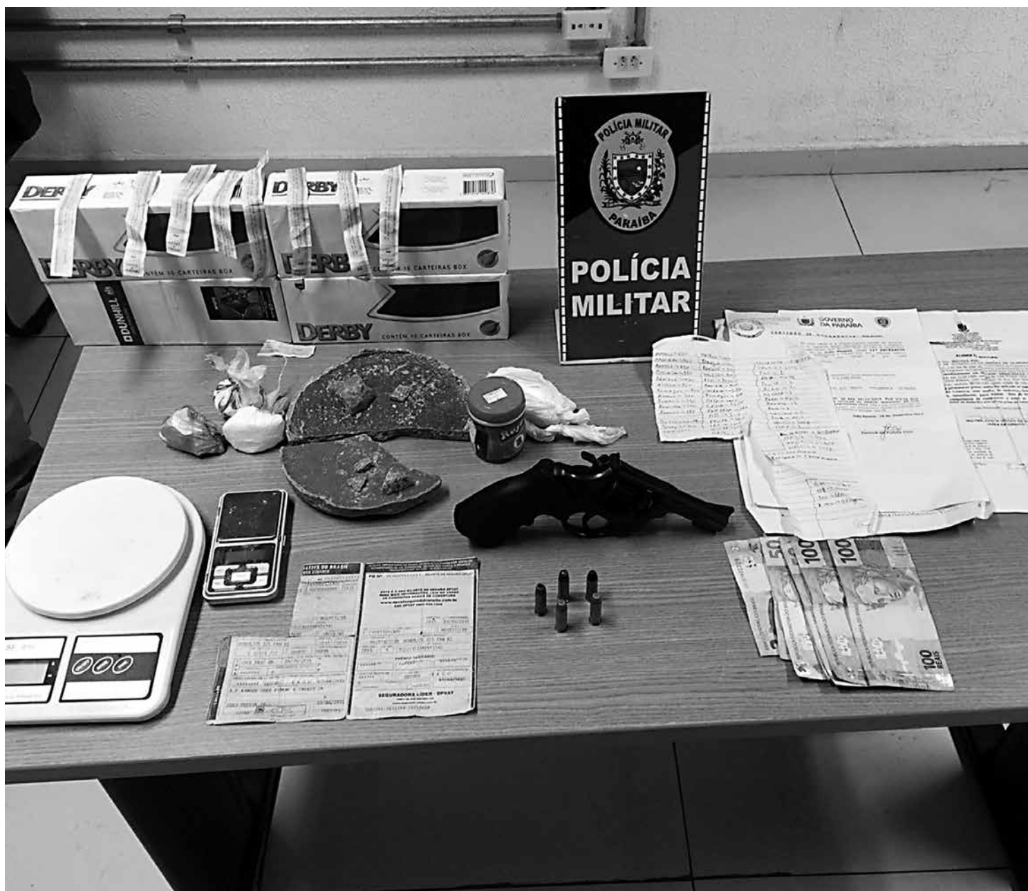
Balança de precisão, telefone celular, um revólver e droga foram encontrados. Os pacotes de cigarro teriam sido roubados no Valentina

Na Companhia Brasileira de Trens Urbanos (CBTU) foi instaurada sindicância para apurar as causas que provocaram o acidente. Os responsáveis pelo procedimento terão 30 dias para apresentar relatório conclusivo.