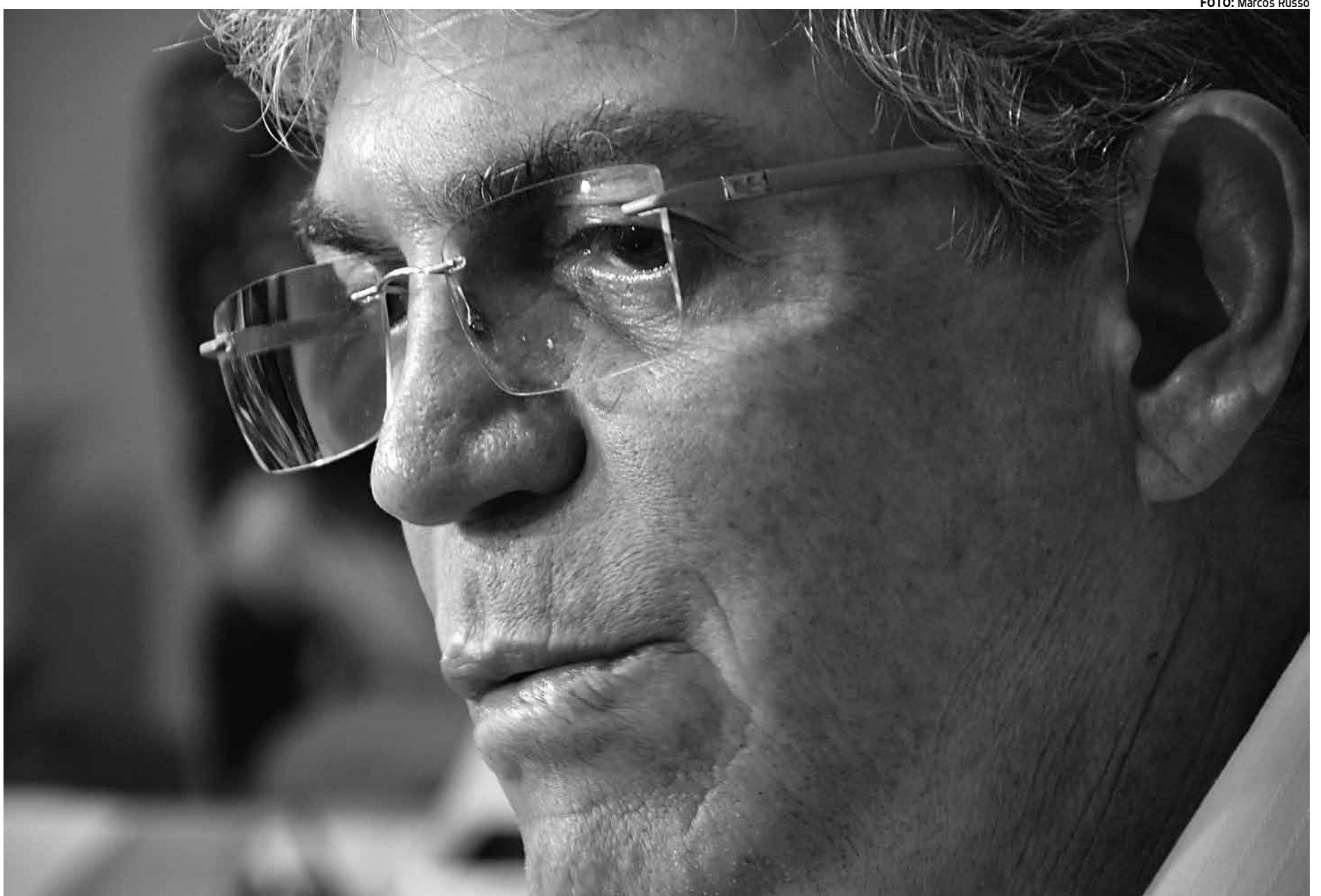
Ricardo Coutinho foi o primeiro governador do País a se posicionar contra os métodos de coerção utilizados ontem durante ação na Operação Lava Jato

Em manifestação realizada na tarde de ontem nas ruas de João Pessoa em solidariedade a Lula, o presidente estadual do PT e pré-candidato a prefeito de João Pessoa, Charliton Machado, criticou o que considerou um movimento fascista. “Nós estamos aqui contra um movimento fascista e que quer fazer justiça a partir do ódio. Estamos combatendo este