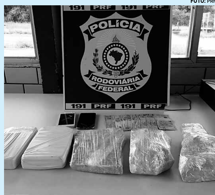
A cocaína e as pedras de crack estavam prontas para consumo

Os homens, o carregamento da droga e o veículo utilizado para o transporte foram encaminhados para a Delegacia da Polícia Civil de Mamanguape, onde foi registrado o flagrante. Caso sejam condenados, os dois suspeitos poderão pegar penas que variam de três a 15 anos de reclusão.