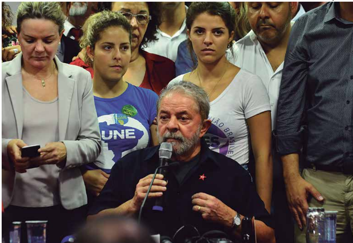
O ex-presidente Lula depôs por cerca de 3 horas no escritório da Polícia Federal no Aeroporto de Congonhas, em São Paulo

Para justificar as ações, o juiz disse que é preciso investigar a fundo a “aparente ocultação e dissimulação de