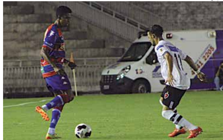
Após vencer o Fortaleza, o Botafogo joga hoje pelo Paraibano