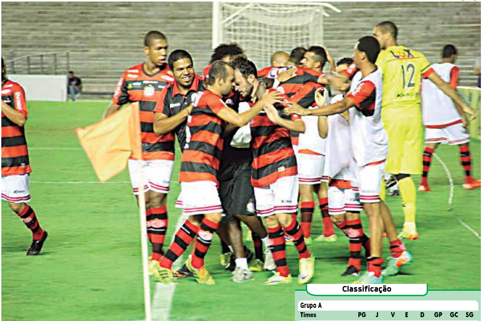
O Campinense faz excelente campanha na Copa e é o segundo melhor clube após quatro rodadas

Este ano, o Campinense já disputou 10 jogos oficiais e conquistou três empates, sendo dois pelo Paraibano, e sete vitórias, três pela Copa do Nordeste.